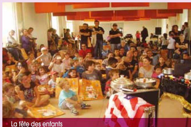
• La fête des enfants