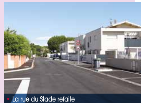
• La rue du Stade refaite

En outre, la municipalité démarre la réfection des routes départementales (engagement n° 63) avec l'avenue de la Carrièresse . Cet été, l'ensemble des réseaux souterrains de cette artère ont été réhabilités. À partir de septembre, la chaussée sera entièrement refaite; sont prévus des dispositifs pour sécuriser cyclistes et piétons en limitant la vitesse des véhicules. Pour cet important investissement, qui totalise 640 000 €, la municipalité a obtenu auprès du Conseil départemental du Gard une subvention de plus de 351 680 € .