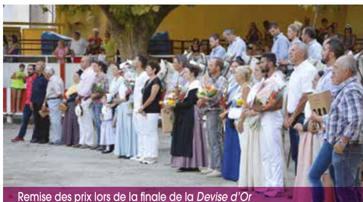
• Remise des prix lors de la finale de la Devise d'Or