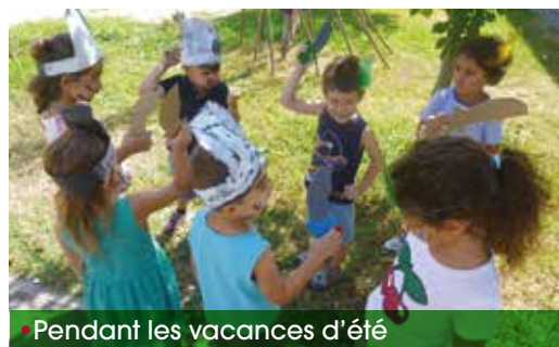
• Pendant les vacances d'été

Lors du conseil municipal du 10 juillet dernier, une subvention exceptionnelle de 7 000 € a été votée en faveur de l'Odysée. Voici quelques explications qui justifient notre choix. L'Odysée subit de plein fouet la baisse, décidée unilatéralement, des subventions accordées par le Conseil départemental et la Caisse d'allocations familiales (CAF). Malgré de réels efforts de gestion (chômage partiel du directeur, non renouvellement de contrats, etc.), notre centre socio-culturel rencontre cette année une difficulté financière. En l'aidant à franchir ce cap, la municipalité se montre responsable.