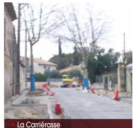
• La Carriérasse