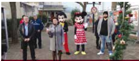
• Marché de Noël, 13 décembre 2015

Nous tenons à remercier les organisateurs de cette journée, la société AK events & Cie représentée