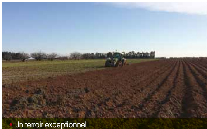
• Un terroir exceptionnel

La mission d'un adjoint délégué à l'agriculture est avant tout de défendre les intérêts des agriculteurs et de protéger l'espace agricole. De par sa proximité avec la ville de Nîmes, Redessan subit une pression immobilière forte et continue. Qui dit urbanisation dit perte de terre cultivable. Avec l'arrivée de la gare TGV et du futur pôle urbain multimodal, notre responsabilité est de protéger notre terroir AOP Costières de Nîmes , ce terroir extraordinaire qui permet la culture de la vigne, d'arbres fruitiers, du maraichage et de l'olivier dans des conditions idéales. La typologie de notre sol va aussi nous permettre de subir le réchauffement climatique dans les meilleures conditions possibles.