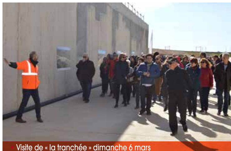
Visite de « la tranchée » dimanche 6 mars

Mais revenons au Projet urbain Multimodal, les élus de la majorité et moi-même avons souhaité dès le début de