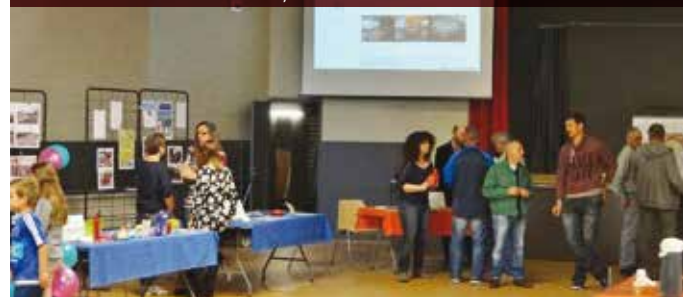
• 1 er rencontre avec les élus, avril 2015