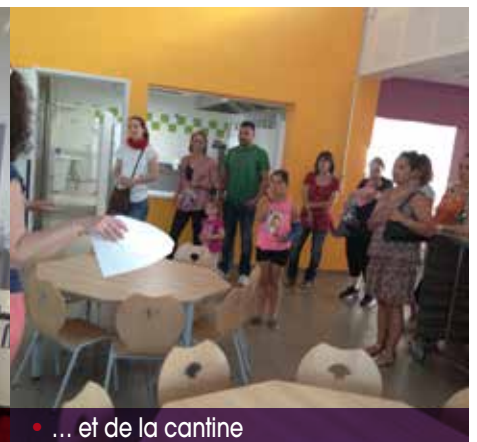
• ... et de la cantine