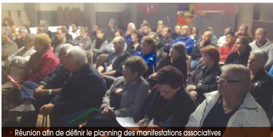
• Réunion afin de définir le planning des manifestations associatives

à la Salle du Parc afin de faciliter les stockages et rangement du matériel associatif.