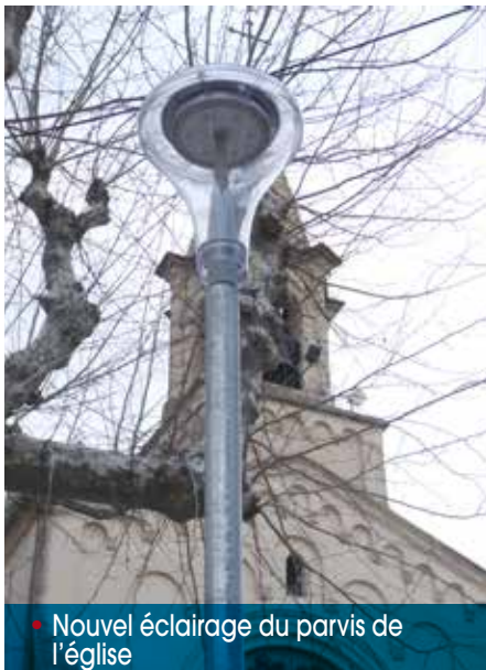
• Nouvel éclairage du parvis de l'église

Le marché étant arrivé à terme, un nouvel appel d'offres a été lancé. Le candidat retenu par la Commission d'appels d'offres est BOUYGUES ENERGIES SERVICES. Ce marché d'une durée de six ans comprend non seulement la maintenance de tout l'éclairage public, mais surtout le passage en LED de la partie vétuste du réseau. La pose