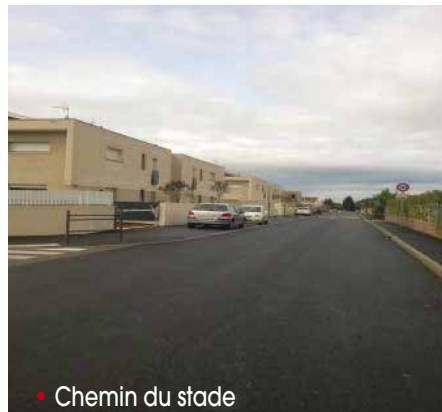
• Chemin du stade

Chemin du Stade – En prolongement de la rénovation du Chemin du Stade, le