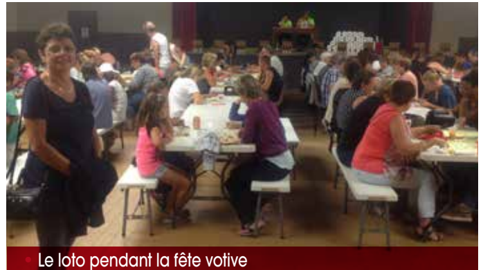
Le loto pendant la fête votive