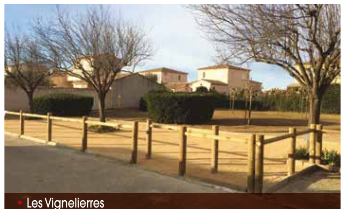
• Les Vignelières