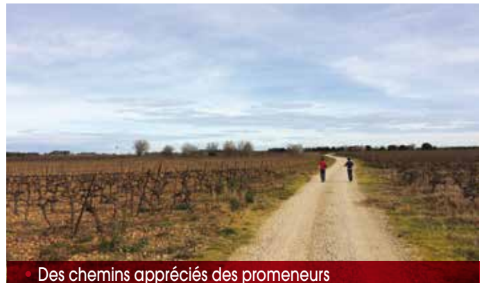
• Des chemins appréciés des promeneurs

Afin de permettre aux agriculteurs de travailler dans les meilleures conditions, mais aussi aux promeneurs et joggeurs de profiter de notre campagne, la municipalité continue de rénover les chemins ruraux et d'assurer l'entretien des fossés communaux avec l'aide du Syndicat des Hautes terres du Vistre, et à faire respecter le Plan Local d'Urbanisme en zone agricole. À ce sujet, pour toute installation de clôtures dans le respect des règles d'urbanisme, une déclaration préalable doit être déposée en mairie.