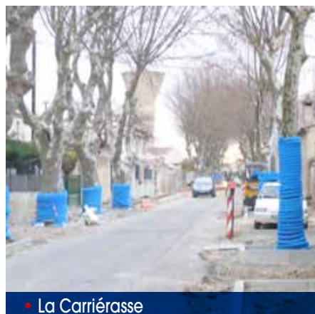
• La Carriérasse

Avenue de la Carriérasse – Les travaux sont en cours. Le planning est respecté. Chaque jeudi matin se tient une réunion de chantier. Lorsque c'est possible, quelques aménagements sont apportés