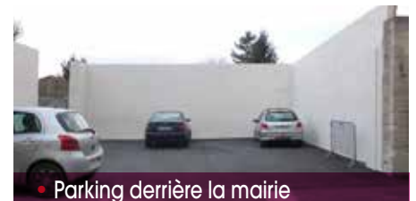
• Parking derrière la mairie

Démolition du hangar derrière la mairie – Ce projet est achevé, créant